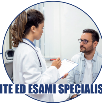
VISITE ED ESAMI SPECIALISTICI