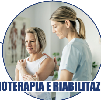
FISIOTERAPIA E RIABILITAZIONE