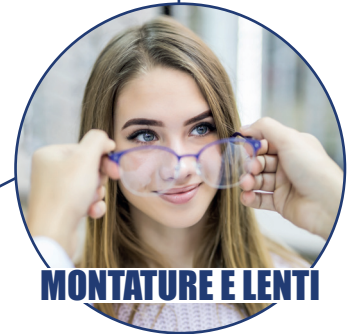
MONTATURE E LENTI